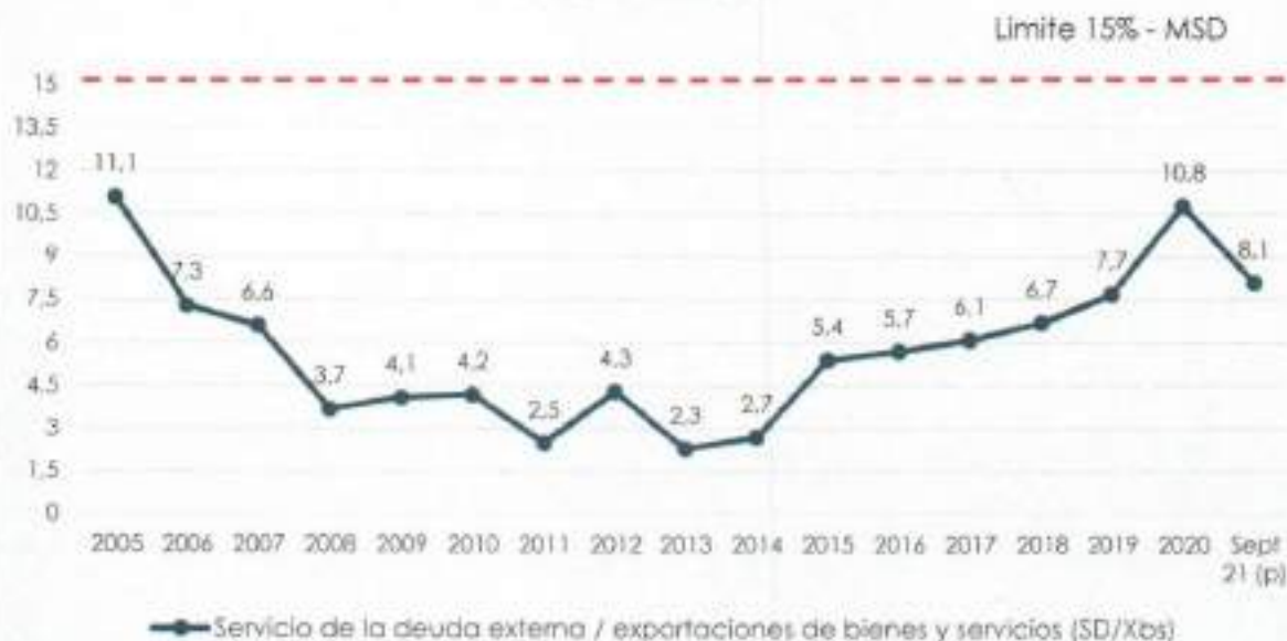
Gráfico N° 2 Servicio de la Deuda Externa / Exportaciones de Bienes y Servicios (En porcentaje)

p) preliminar según datos económicos del BCB