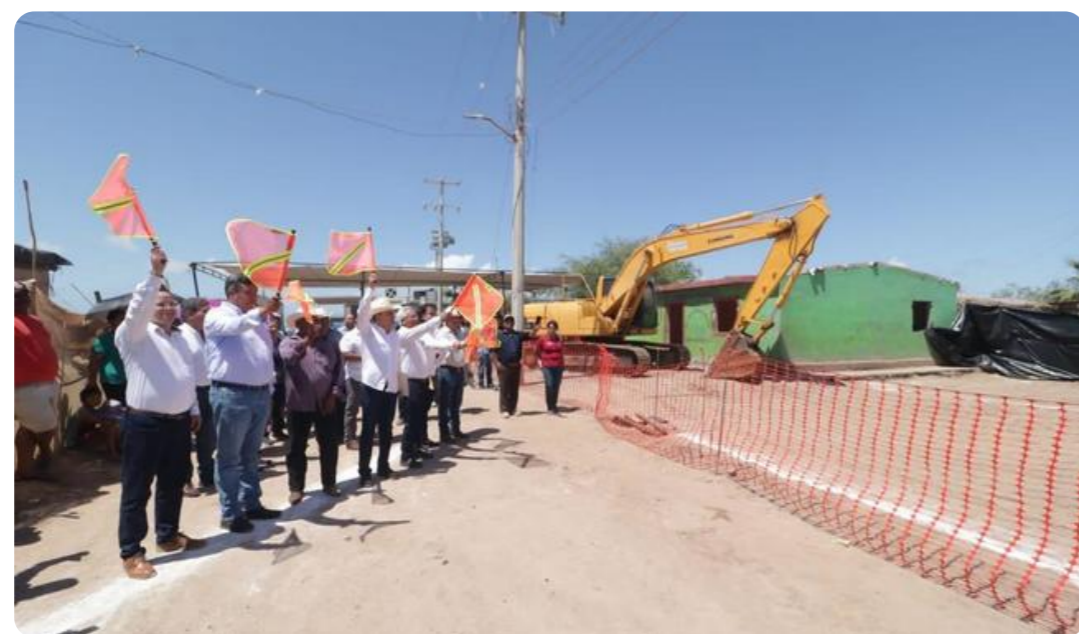
Arranca Segunda Etapa del Proyecto Estratégico para el Desarrollo para la Justicia al Pueblo Yaqui 2023

Comisión Nacional de Acuacultura y Pesca | 08 de agosto de 2023 | Comunicado