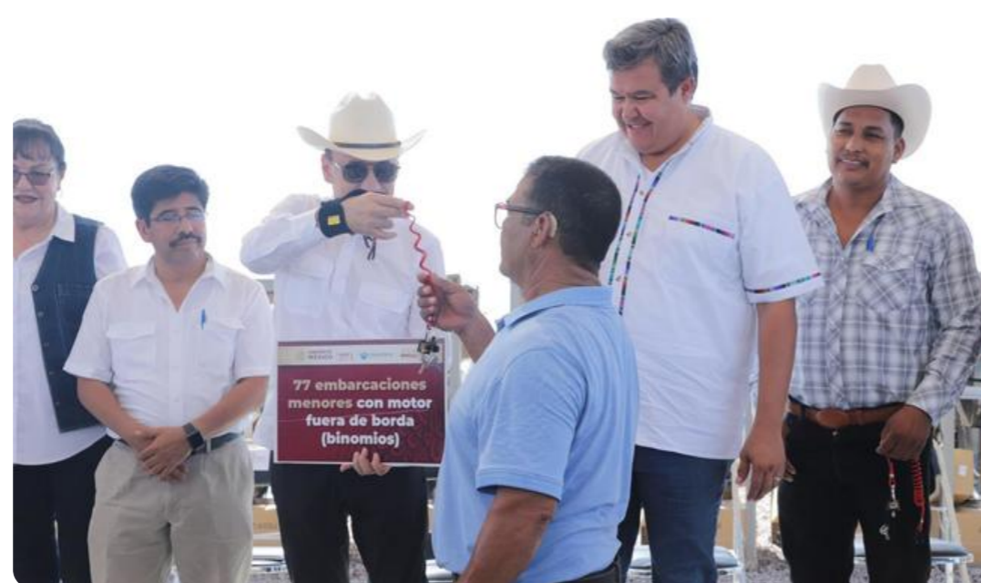
Cumple al 100% CONAPESCA su misión dentro del Plan de Justicia para el Pueblo Yaqui

Comisión Nacional de Acuacultura y Pesca | 27 de agosto de 2024 | Comunicado