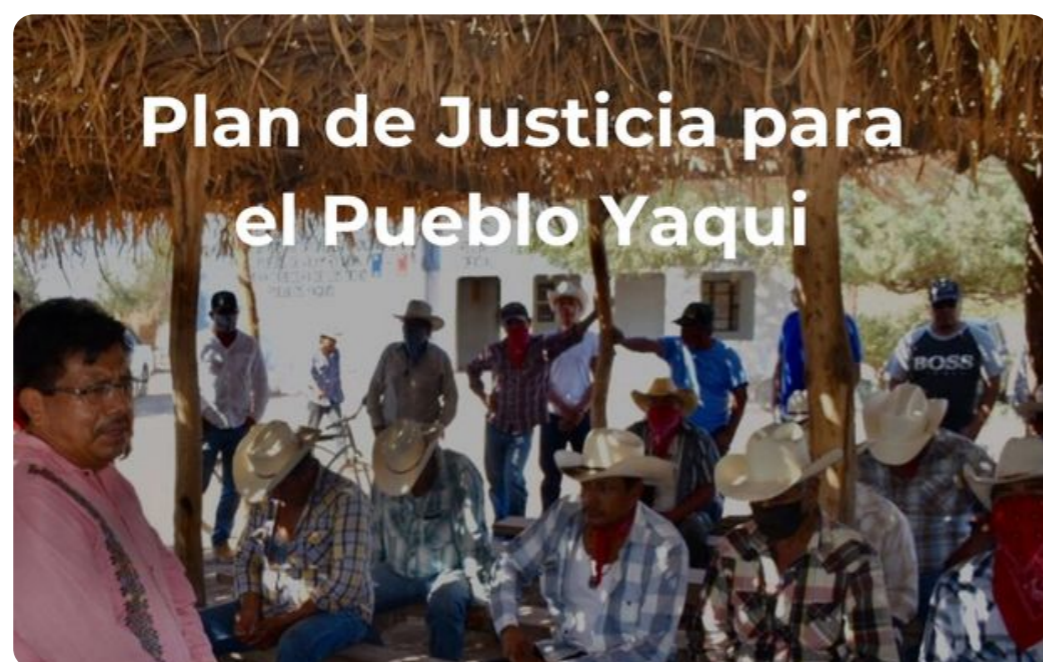
Plan de Justicia para el Pueblo Yaqui

Secretaría de Agricultura y Desarrollo Rural | 28 de septiembre de 2022