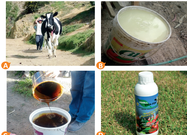
Figura 5. Lista de insumos a utilizar en el proceso de elaboración del biofertilizante: A) Estiércol de animal. B) Suero de leche. C) Melaza. D) Bio-Lac.

Los insumos básicos para la producción de biofertilizante líquido acelerado son: estiércol de animal, suero de leche, melaza y cultivo bacteriano (Bio-Lac) (Figura 5).