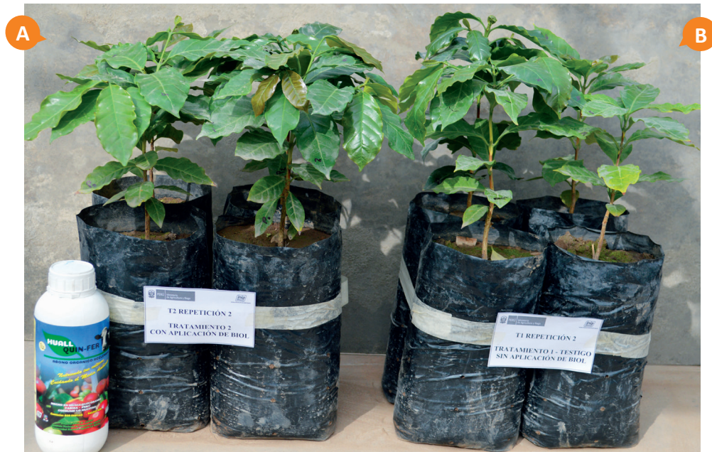
Figura 12. Plantas de café a nivel de vivero. A) Con aplicación de biofertilizante líquido acelerado - HUALQUIN FER. B) Sin aplicación.

En los ensayos realizados en platones de café a nivel de vivero y con la participación de la Asociación de Productores Cafetaleros “Pirir Piri” del distrito de San Luis de Shuaro - Chanchamayo, se realizaron aplicaciones del biofertilizante líquido a una dosis de 20 mL en plantas de café y un total de seis aplicaciones a nivel de vivero, donde mostró una respuesta positiva en cuanto al parámetro de altura de planta, diámetro del tallo, número de ramas por planta, ancho de hoja, concentración de nitrógeno, fósforo y calcio, en comparación con el cultivo no tratado (Figura 12).