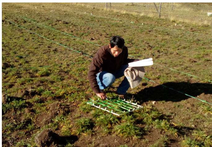
Figura 11. Productor de la cooperativa agropecuaria de servicios Valle del Cunus Ltda., mostrando los resultados de la aplicación del biofertilizante líquido en el cultivo de la maca, Chupaca-Junín.

Con la cooperativa Agropecuaria de Servicios Valle del Cunus Ltda (Figura 11) y el apoyo de la Agencia Agraria de Chupaca, se concluyó que con el uso del biofertilizante líquido acelerado en 15 hectáreas de maca orgánica certificada en la zona de Qhishtucapampa, Alto Cunus - Chupaca, se logró obtener un rendimiento de 2.8 toneladas/hectárea, superior a campañas anteriores, en las que solo se obtenía un promedio de 1.8 toneladas/hectárea.