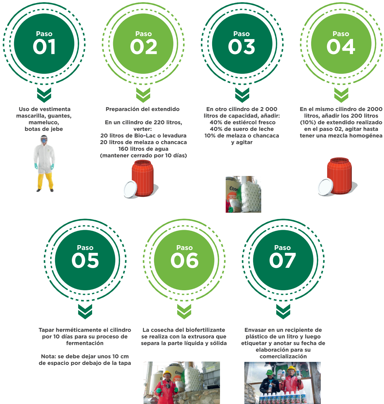
Figura 9. Proceso de producción de biofertilizante líquido en módulo grande (2 000 litros).