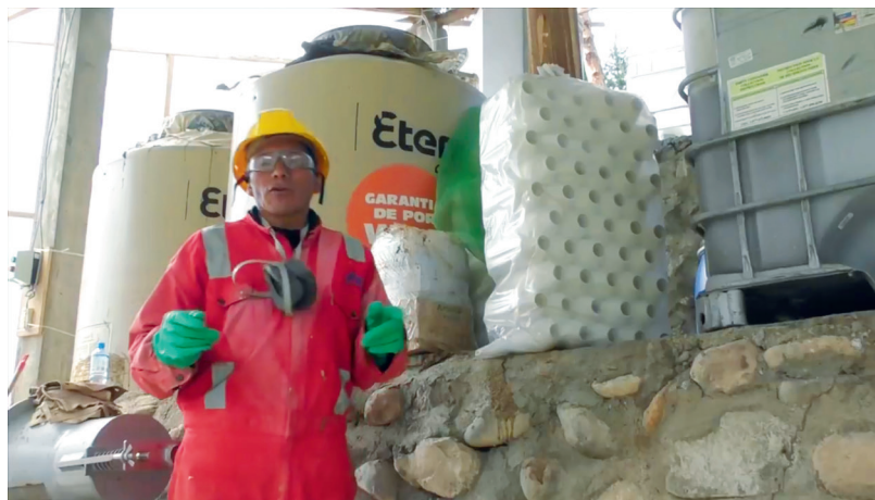
Figura 1. Planta de producción del biofertilizante líquido acelerado en la comunidad Huallquin Grande – Tarma, Junín. 2017.

La tecnología utilizada en plantas de mediana escala en las zonas altoandinas (Figura 1), permite la obtención de biofertilizantes para su posterior aplicación en los diferentes cultivos. Una vez obtenido el producto fermentado, puede ser aplicado vía foliar en cultivos como: maca, quinua, pastos, hortalizas, café, flores, entre otros.