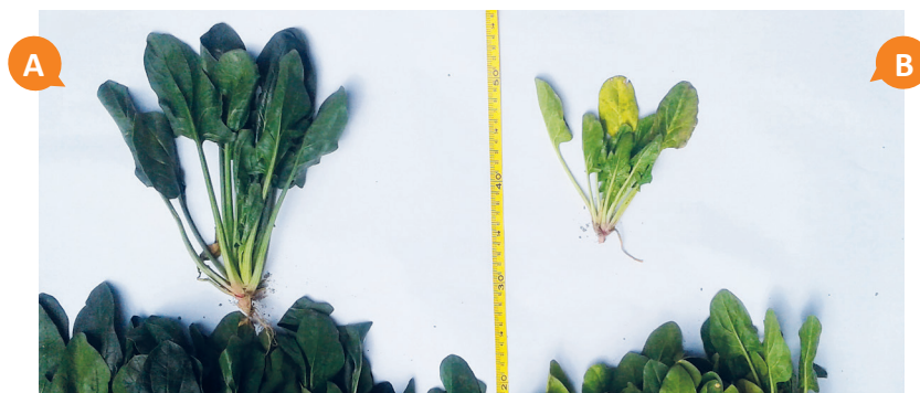
Figura 10. Comparación del cultivo de la espinaca. A) Con aplicación del biofertilizante líquido acelerado. B) Sin aplicación del biofertilizante líquido acelerado.

Con la participación de la Asociación de Productores de Hortalizas “Gruta del Huagapo” en Palcamayo - Tarma, se instalaron parcelas de ensayo para el cultivo de espinaca, en los cuales se demostró que con el uso del biofertilizante líquido acelerado, se logró obtener un rendimiento de 33 t/ha, superior al reporte local de 26 t/ha. En la figura 10, se observan las diferencias obtenidas después del uso del biofertilizante líquido acelerado.