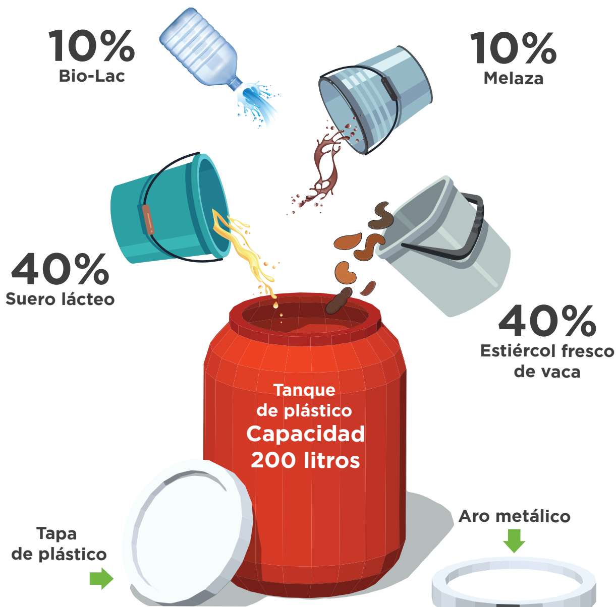
Figura 8. Proceso de producción de biofertilizante líquido en módulo mediano (200 litros).