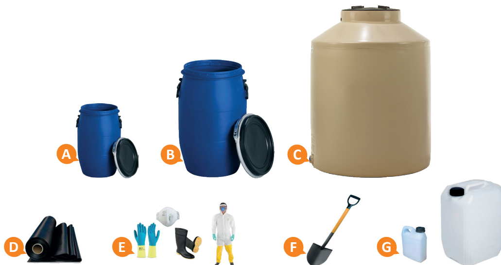
Figura 3. Lista de materiales a utilizar en el proceso de elaboración del biofertilizante. A) Cilindro de módulo pequeño. B) Cilindro de módulo mediano. C) Cilindro de módulo grande. D) Plástico. E) Ropa de protección (botas, ropa impermeable, guantes, tapa bocas y cobertor de cabello). F) Pala. G) Envase y balde de 1 litro y 20 litros.