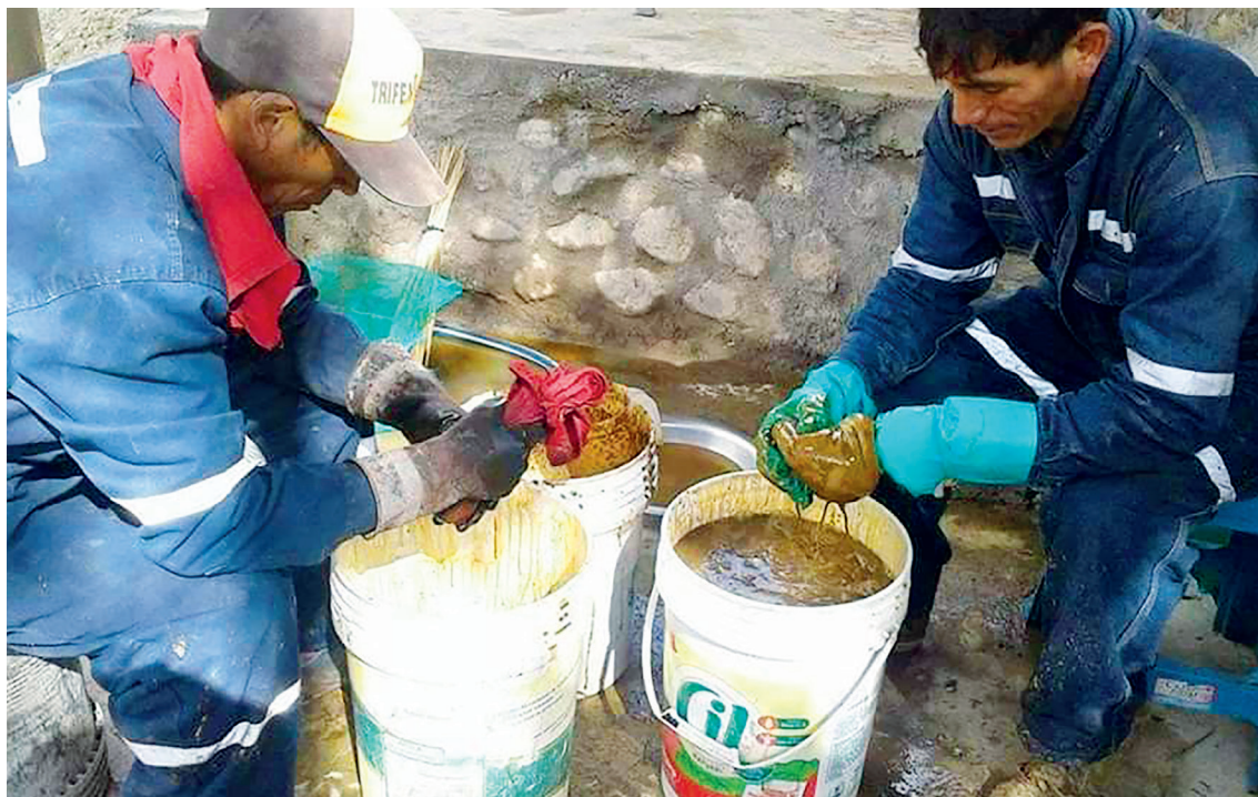
Figura 2. Manipulación de estiércol de vaca para la producción de biofertilizante.

Material compuesto por residuos generados después de la digestión final de los alimentos. Su composición nutricional reporta la presencia de nitrógeno, potasio y fósforo (Fajardo y Sarmiento, 2007), así como de microorganismos vivos de fermentación anaeróbica, por lo que su manipulación debe realizarse cuidadosamente empleando guantes como medida de seguridad (Figura 2).