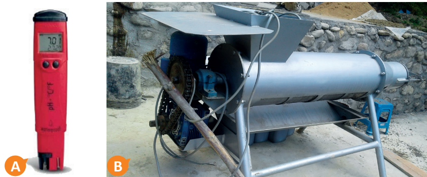
Figura 4. Equipamientos básicos para la elaboración del biofertilizante líquido. A) pH-metro. B) Extrusor para el filtrado del abono orgánico.

Además de los materiales descritos en el ítem 2.1, se necesitan los siguientes equipamientos: pH-metro y extrusor para el filtrado de abono orgánico (Figura 4).